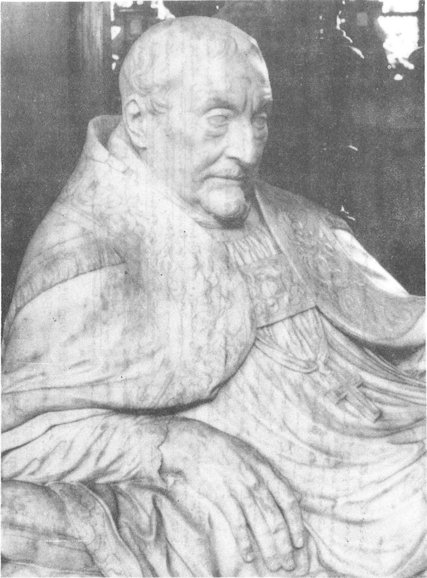
Fragment van het praalgraf van bisschop TRIEST in de Sint-Baafskatedraal te Gent.